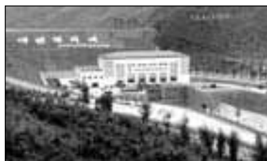
Kraftverket Huichon blir det största av de vattenkraftverk som byggts på senare tid i Korea.

för att producera stora mängder tyg av god kvalitet av vinalonfibrer och Hungnams konstgödsselfabrik har på kort tid genomfört första steget i ett förgasningsprojekt för att producera konstgödsel av inhemska råvaror med inhemskt bränsle. Taehung-ungdomens hjältegruva har börjat producera magnesiumprodukter med lokalt tillgängliga råvaror i stället för koks. Rongyang-gruvan har moderniserats. Maskinkomplexet Ryongsong har tillverkat modern geotermisk utrustning och i Tanchons hamn har en fördämning på långt över en kilometer blivit klar på mindre än två år trots svåra naturförhållanden—ett jobb som beräknats ta omkring tio år.