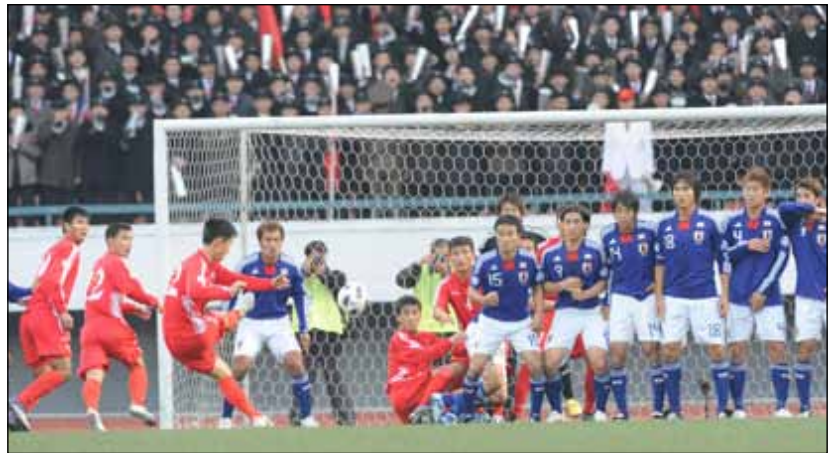
DFRK:s lag slår en frispark mot Japan i Kim Il Sung-stadion.

Redan det faktum att matchen hölls är intressant då det var första gången på 22 år som det japanska landslaget